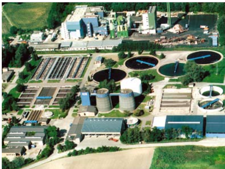
Geisellbullach, szennyvíztisztító telep: 250.000 LE

Cleartec Water Management GmbH Großwichtach 2 u. 4 D-96364 Marktrodach Tel.: +49 9261 967-25/-26 Fax: +49 9261 967-62 E-Mail: info@cleartec.de Internet: www.cleartec.de